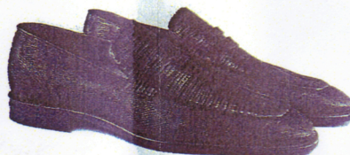
07_Buch Tom Wolfe: „Fegefeuer der Eitelkeiten“ ROWOHLT TB 12,90 Euro 08_Tasche JIL SANDER 1420 Euro 09_Schuhe BALLY 495 Euro 10_Schuhe DIOR HOMME 700 Euro