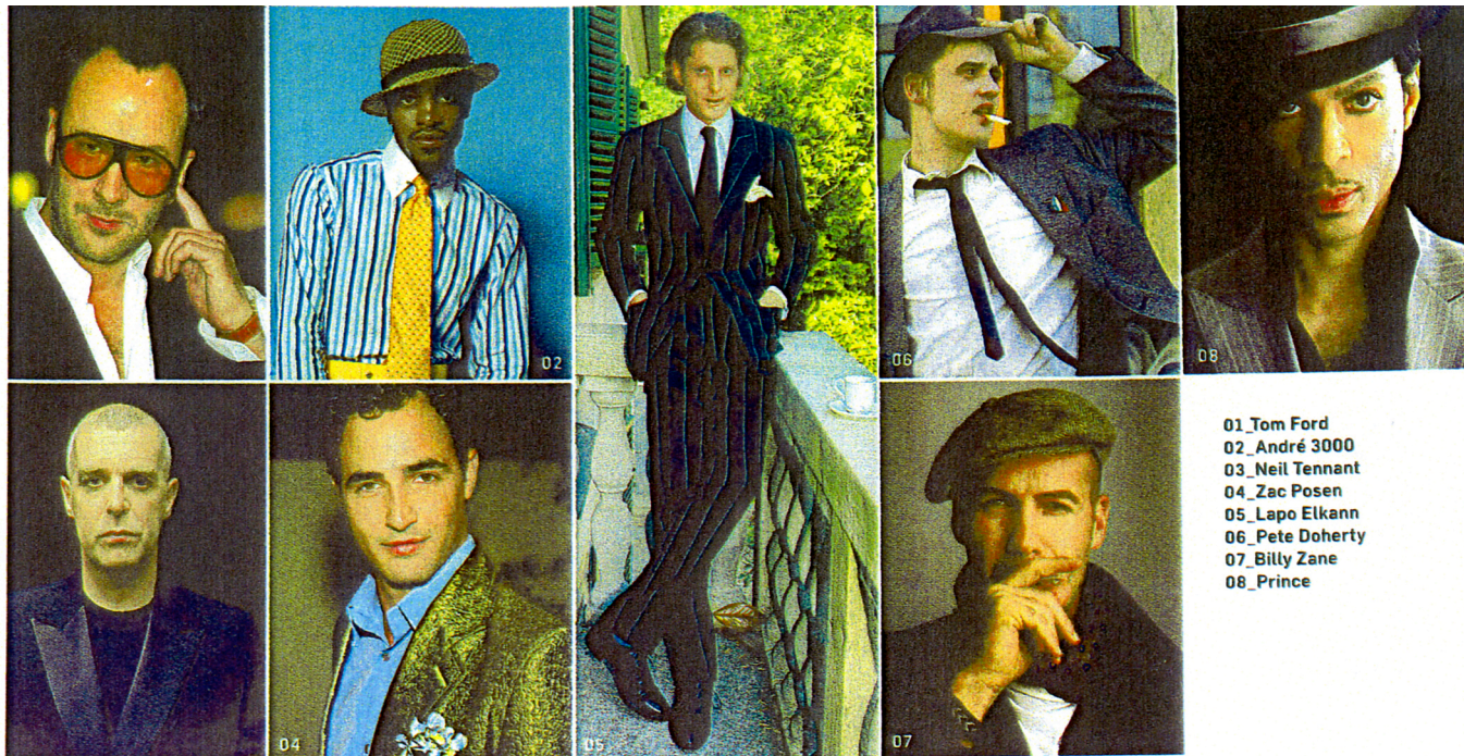
01_Tom Ford 02_André 3000 03_Neil Tennant 04_Zac Posen 05_Lapo Elkann 06_Pete Doherty 07_Billy Zane 08_Prince